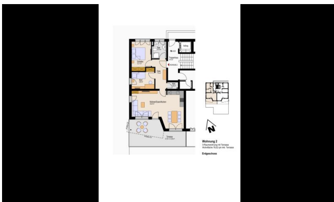
Wohnung 2-1 (Grundriss)