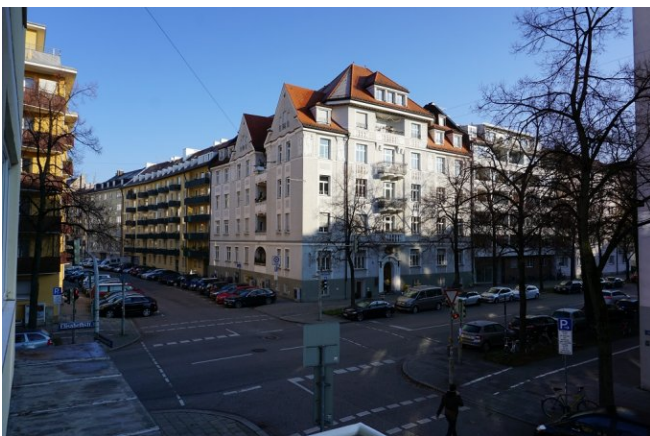
... mit Zutritt auf den Balkon