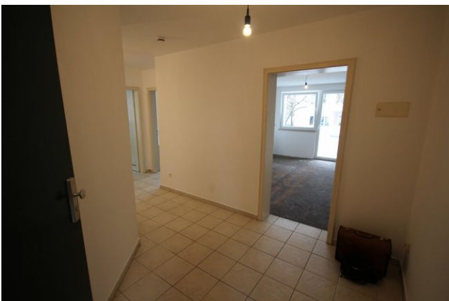
die geräumige Diele