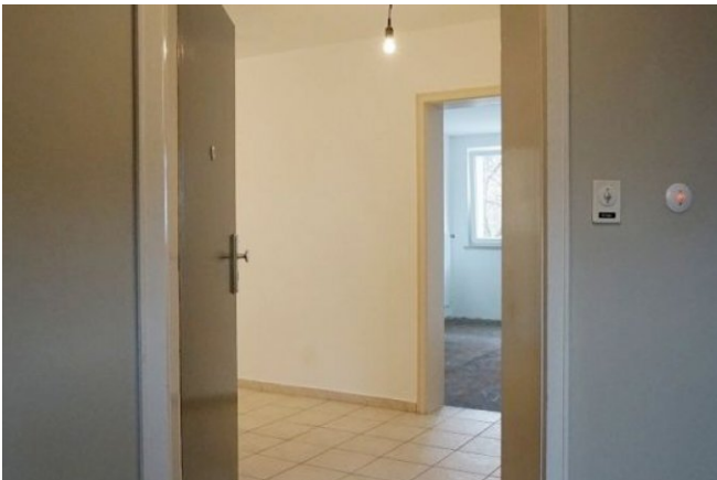
Zugang zur Wohnung